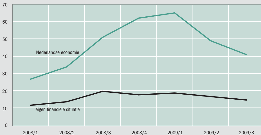
Figuur 1.1 Percentage mensen met negatieve verwachtingen over de eigen financiële situatie en over de Nederlandse economie a , bevolking van 18+, 2008-2009

Vergeleken met vorig kwartaal zijn de Nederlanders wederom minder pessimistisch geworden over de economie. Als we kijken naar de verwachtingen voor het komende jaar, geeft momenteel 40% aan een verslechtering te verwachten, waar dat aan het begin van 2009