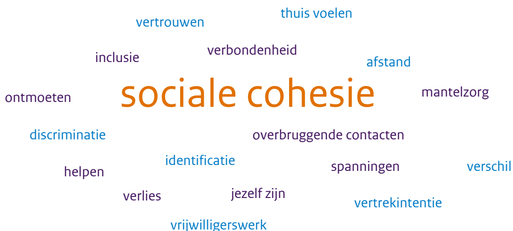
Figuur S.1 Indicatoren van sociale cohesie in de drie onderzochte domeinen wonen, onderwijs en werk